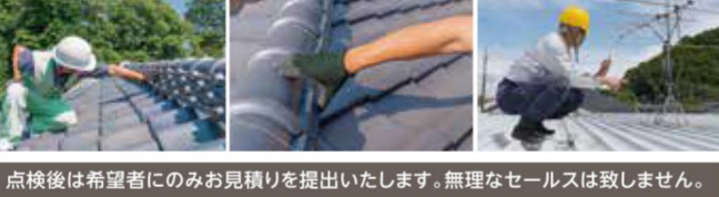
点検後は希望者へののみお見積りを提出いたします。無理なセールスは致しません。