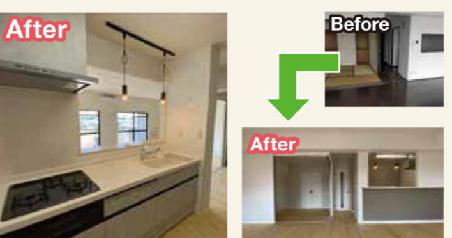
マンションをフルリノベーション

かなり年月が経過したキッチンをリフォーム。使いやすく、広々としたキッチンに様変わりしました。同時に床の張替えもおこないました。床の色を明るい色にしたことでお部屋全体の雰囲気はかなり明るくなりました。