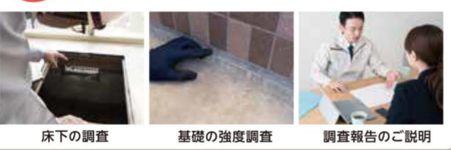
床下の調査 基礎の強度調査 調査報告のご説明